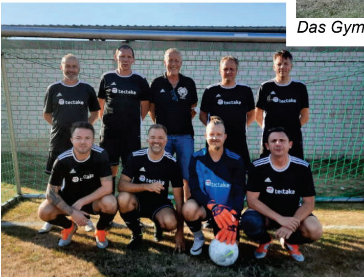
Buir – 3. Platz nach Sieg über Kelz

schaften es souverän ins Endspiel, während unser Team sich im Spiel um Platz 3 dem Team aus Buir knapp mit 1:2 geschlagen geben musste. Das Endspiel entschied sich dann erst im Elfmeterschießen.