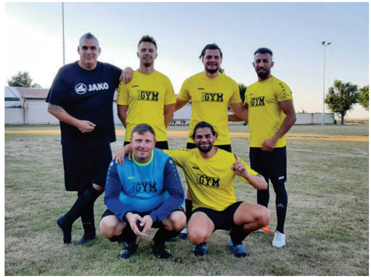
Das Gym – 2. Platz nach Elfmeterschießen

Am 2. Sportwochen- Wochenende veranstaltete unsere "Alten Herren" ein Kleinfeldturnier mit 6 Mannschaften, darunter auch unser Team.