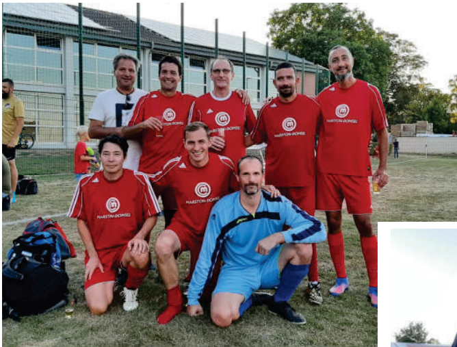
TUS Zülpich - Turniersieger

Ursprünglich hatte man mit 12 Mannschaften geplant, doch leider gab es einige kurzfristige Absagen. Die beiden Zülpicher Teams